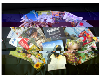
生與遊攝 (2015 3月8日)