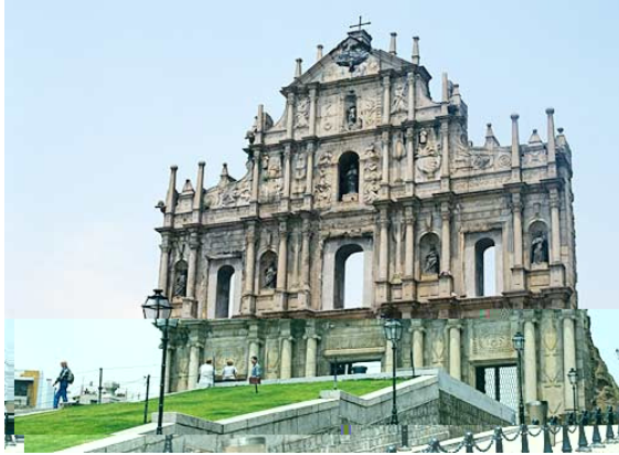
澳門世界遺產報導課程—行程表