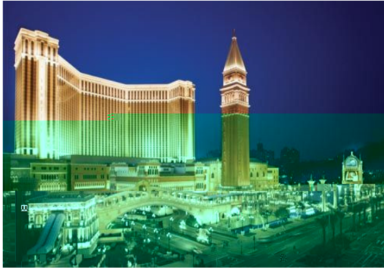
澳門五星級酒店探訪課程--行程表